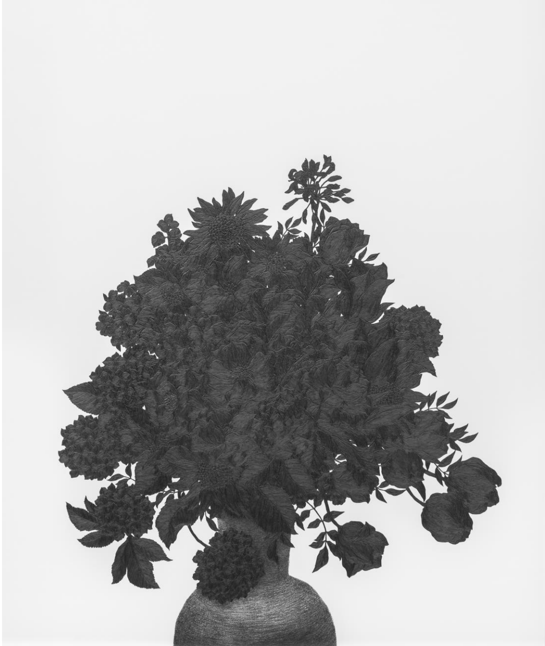
김은주, 그려보다-190822, 종이 위에 연필, 80x100cm, 2019